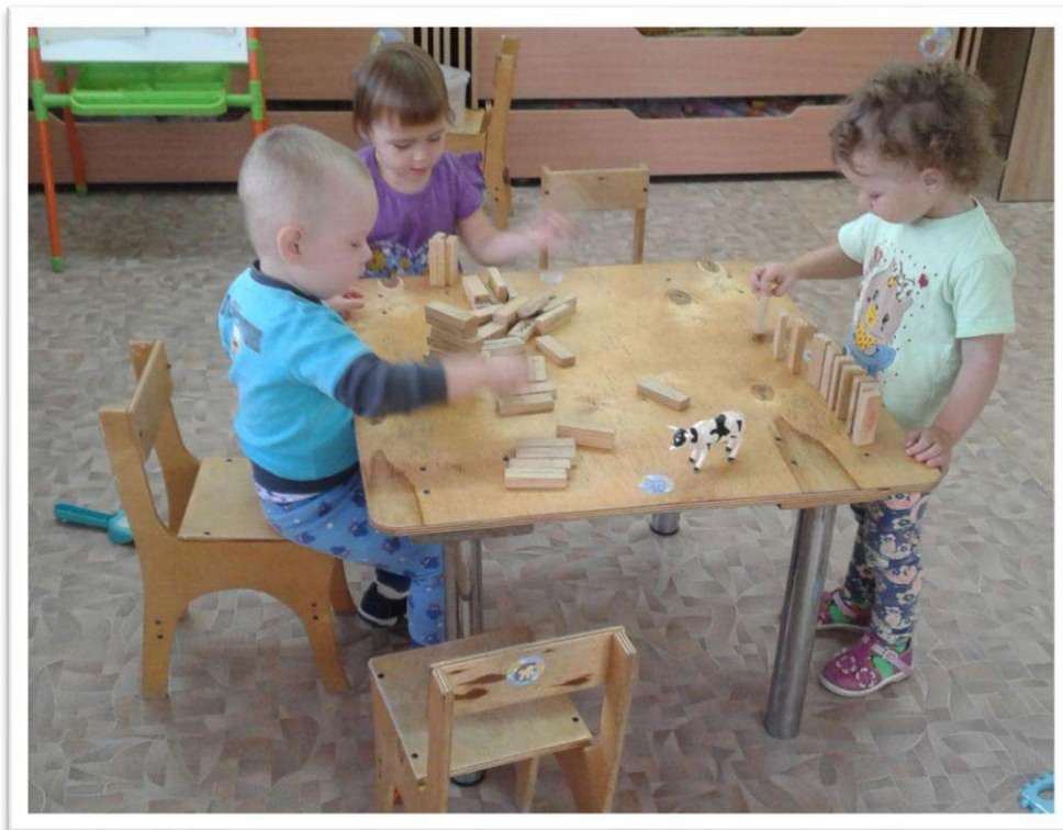
Конструирование больших и маленьких домов. (Обыгрывание построек с помощью мелких игрушек).