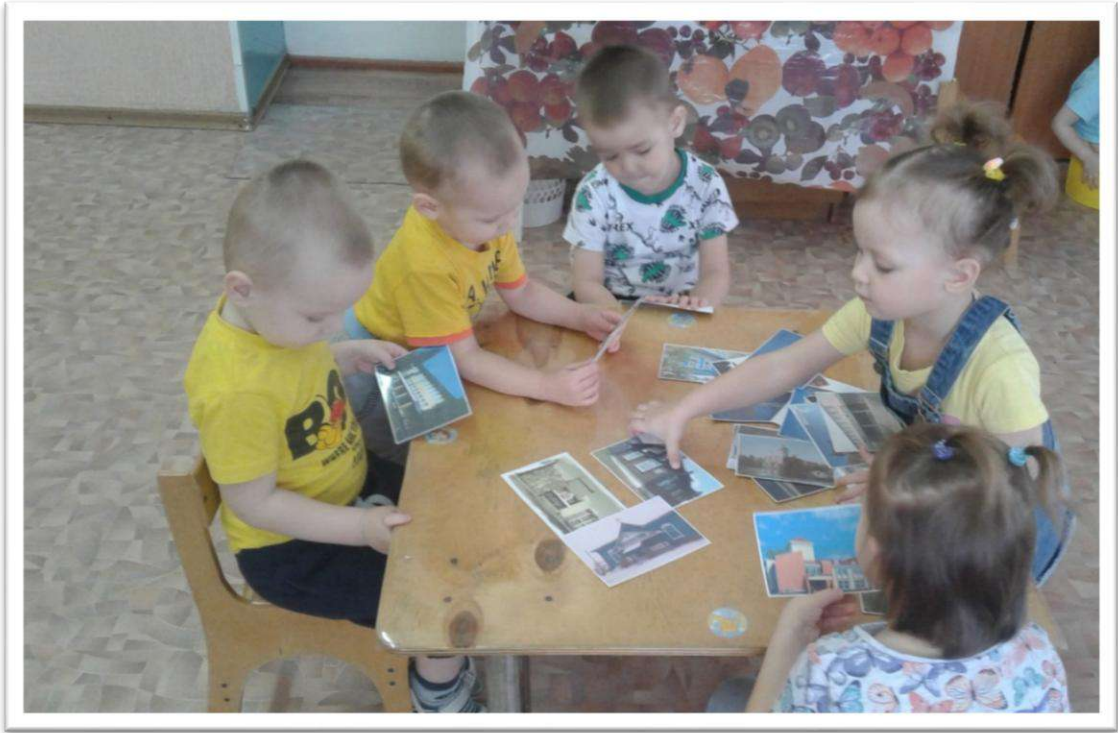
Дидактические игры: «Найди пару»