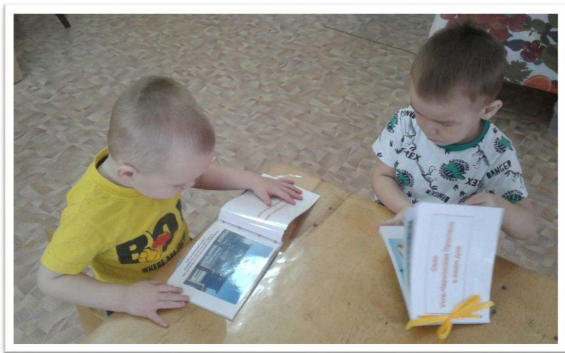
Рассматривание фотоальбома «Село Усть-Чарышская Пристань в наши дни»