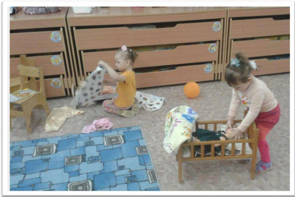
Сюжетно – ролевая игра «Семья», сюжет «Укладываем Катя спать»