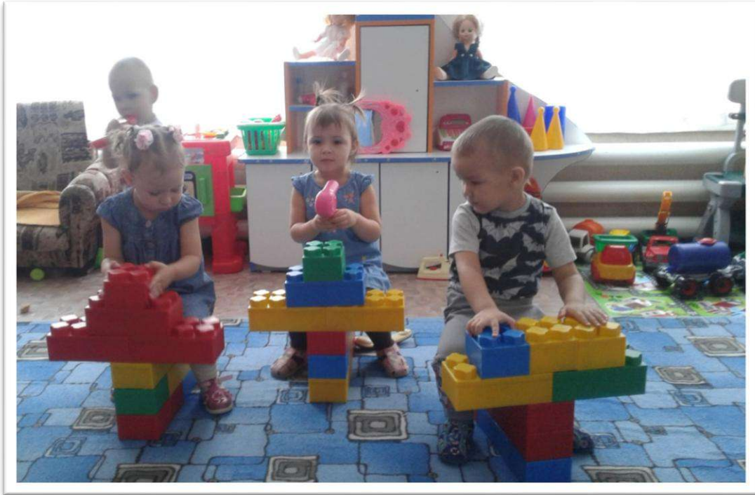
Сюжетно – ролевая игра «Семья» сюжет: «Я катаюсь на велосипеде»