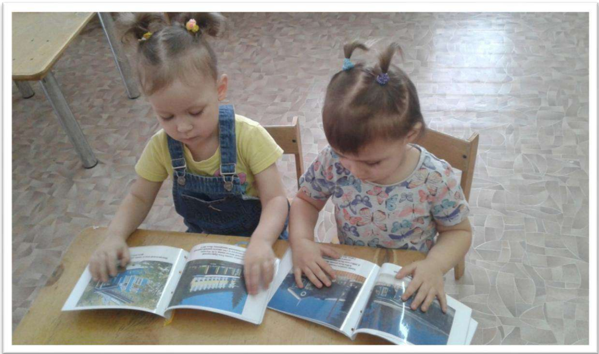
Рассматривание фотоальбома «с.Усть-Чарышская Пристань »